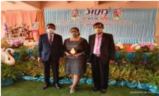
ครูดีในดวงใจ ระดับ สพฐ.