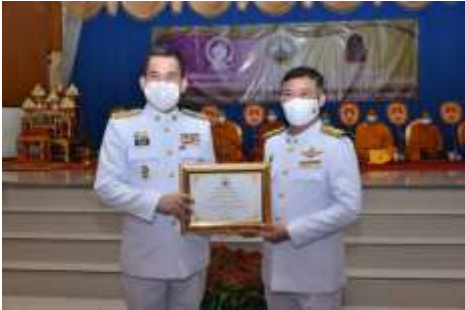
ข้าราชการพลเรือนดีเด่นระดับจังหวัดฉะเชิงเทรา