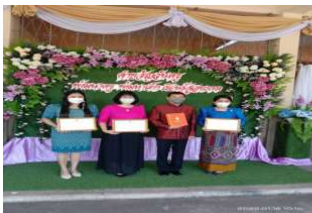
รางวัล OBEC AWARDS ระดับภาค

รายงานผลการพัฒนาข้าราชการครูและบุคลากรทางการศึกษา ปีงบประมาณ 2564 กลุ่มพัฒนาครูและบุคลากรทางการศึกษา สำนักงานเขตพื้นที่การศึกษาประถมศึกษาฉะเชิงเทรา เขต 2