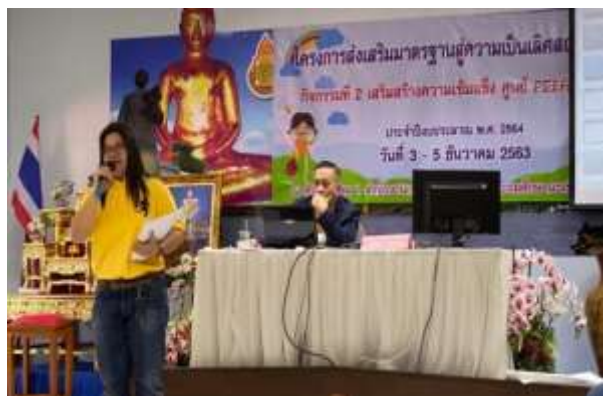
รายงานผลการพัฒนาข้าราชการครูและบุคลากรทางการศึกษา ปีงบประมาณ 2564 กลุ่มพัฒนาครูและบุคลากรทางการศึกษา สำนักงานเขตพื้นที่การศึกษาประถมศึกษาฉะเชิงเทรา เขต 2