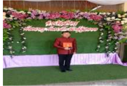
รางวัลครูสุดดี