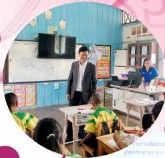
การพัฒนาการเรียนรู้อิง เด็กปฐมวัย พ.ศ. 2567